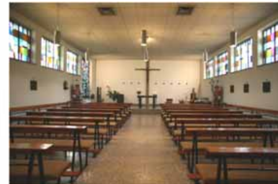
Waldstr. 11, 12487 Berlin-Johannisthal