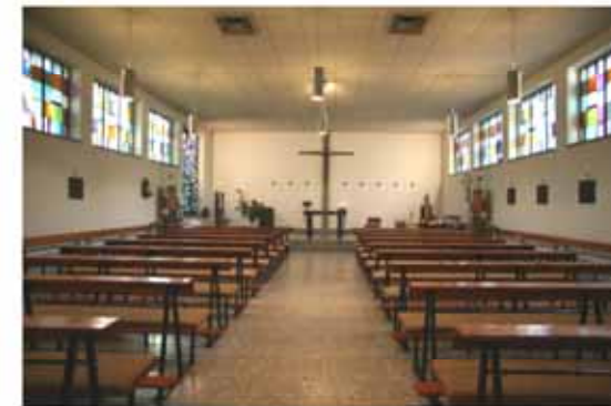
Waldstr. 11 , 12487 Berlin-Johannisthal