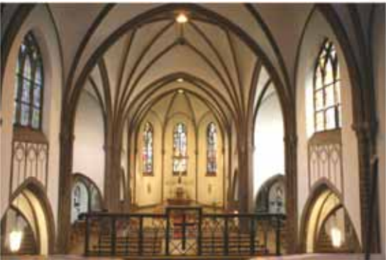
Roedernstr. 2, 12459 Berlin-Oberschöneweide