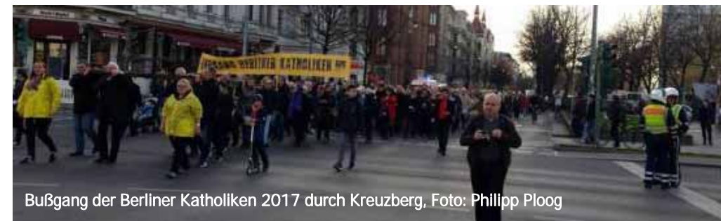
Bußgang der Berliner Katholiken 2017 durch Kreuzberg