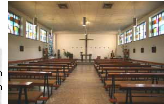
Waldstr. 11, 12487 Berlin-Johannisthal