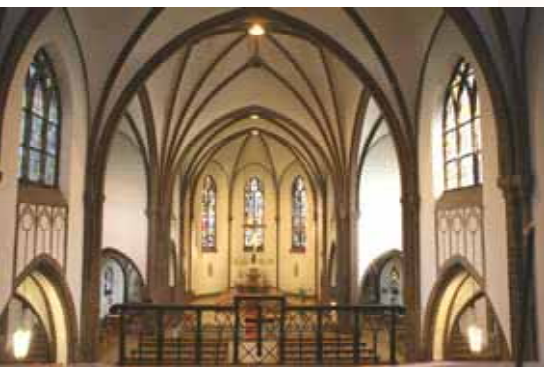
Roedernstr. 2, 12459 Berlin-Oberschöneweide