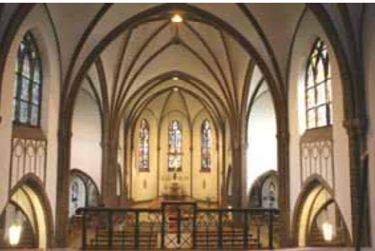
Roedernstr. 2, 12459 Berlin-Oberschöneweide