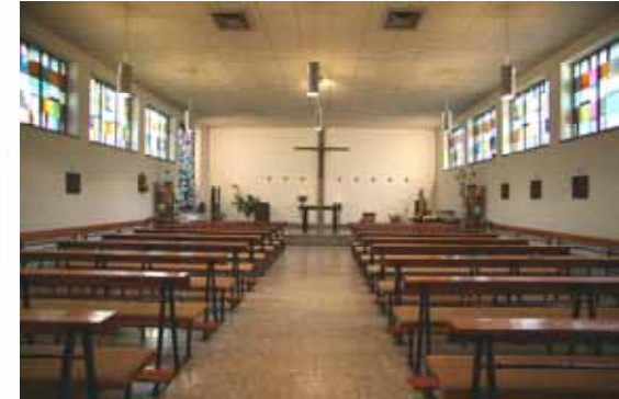
Waldstr. 11, 12487 Berlin-Johannisthal

Sonntag, 31.12., 17:00 mit sakramentalem Segen